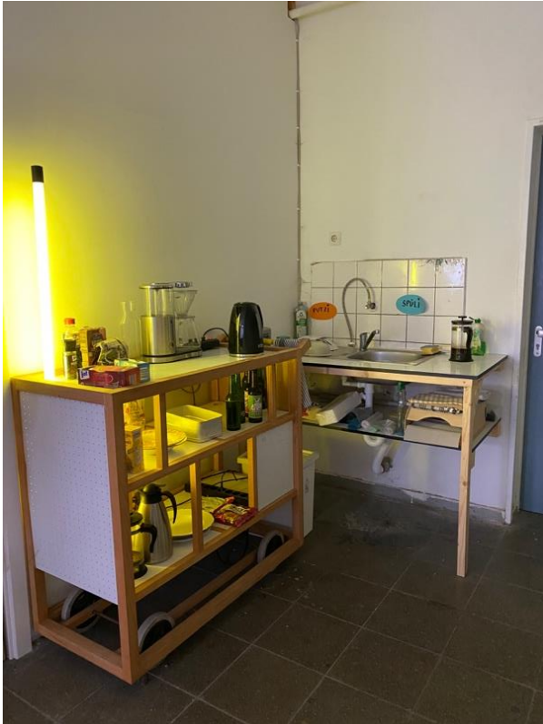
3 kleine Teeküche im Hauptraum