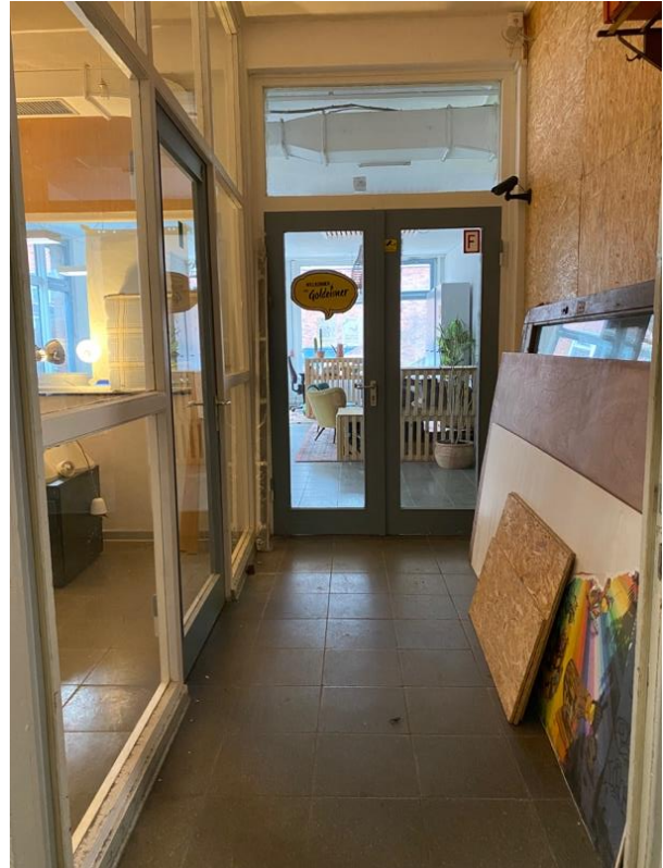
2 Flur zum Hauptraum geradeaus, linksseitig Aquarium