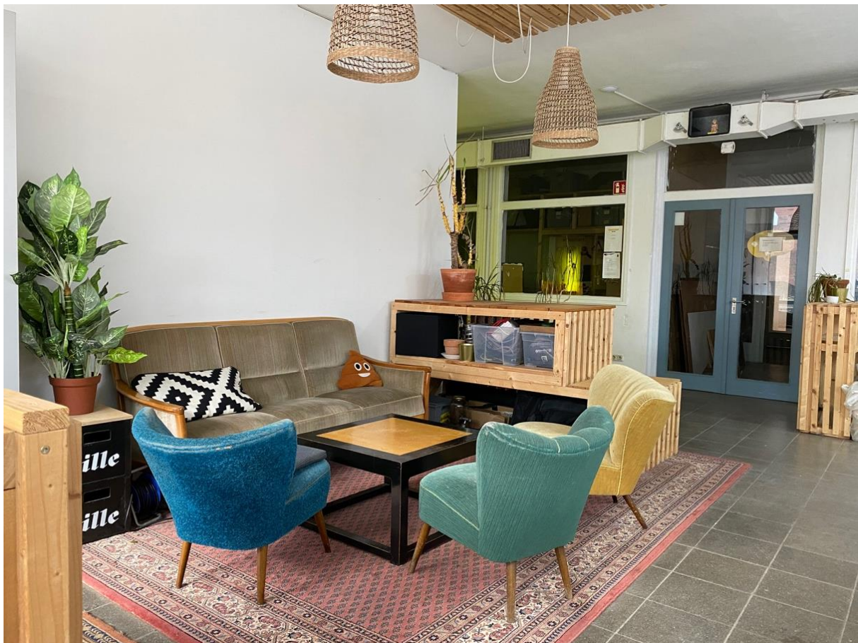
1 Hauptraum mit Blick auf den Flur (blaue Flügeltür)