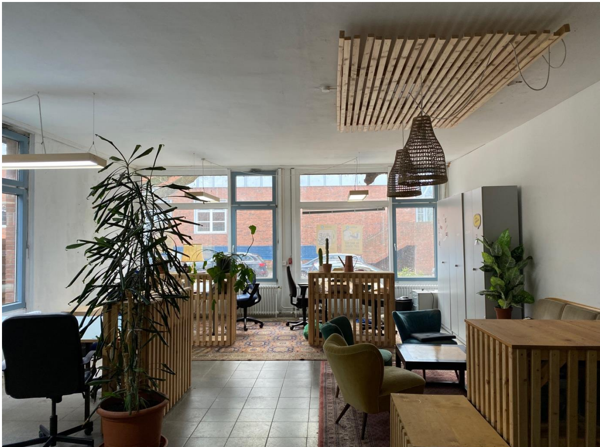
1 Blick in den Hauptraum mit Fensterfront zum Lorentzendamm